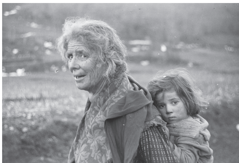
Italie. 13/01/1944. Portrait d'une vieille dame et d'un enfant quittant leur village. Réf. : TERRE 145-3209

Les candidatures devront être envoyées le 20 juillet 2023 à 17 h au plus tard.