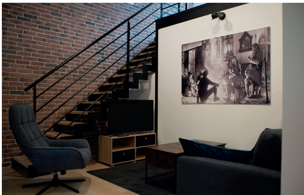
Vue intérieure du studio 1 de La Résidence au Fort de l'ECPAD.

- Aucun rendez-vous ne sera proposé aux candidats pendant la phase de sélection, toutes les demandes devront être faites par téléphone ou courriel à : actions-culturelles@ecpad.fr / 01 49 60 59 96 – 01 49 60 52 70